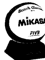
Mikasa Mini-Beachvolleyball VX 3.5 [7]

Zusätzlich zu den angegebenen Preisen erhalten die Teilnehmer personalisierte Urkunden, auf denen die Unterstützung des Studentenrates besonders hervorgehoben wird.