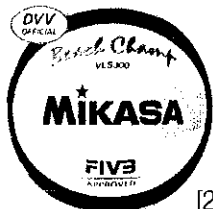
Mikasa *Beach Champ VLS 300 [2]