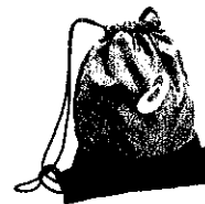
TR Core Gym Sack [4]